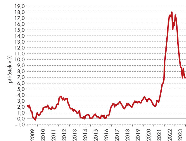
Index spotřebitelských cen (stejně období předchozího roku = 100)

Tato míra inflace je vhodná ve vztahu ke stavovým veličinám, které měří změnu stavu mezi začátkem a koncem období bez ohledu na průběh vývoje během tohoto období. Bere se v úvahu při propočtech reálné úrokové míry, reálného zvýšení cen majetku, valorizací apod.