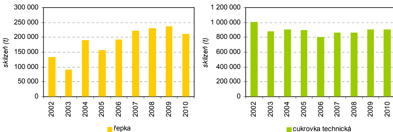
Sklizeň řepky a cukrovky technické ve Středočeském kraji v letech 2002 až 2010

K nepatrnému meziročnímu navýšení plochy (o 6,6 %) i sklizně (o 0,5 %) v kraji došlo v roce 2010 u cukrovky technické . Pěstování cukrovky ve Středočeském kraji značně vyniká mezi ostatními kraji v ČR, podíl na celorepublikové produkci za rok 2010 činil 29,6 %.