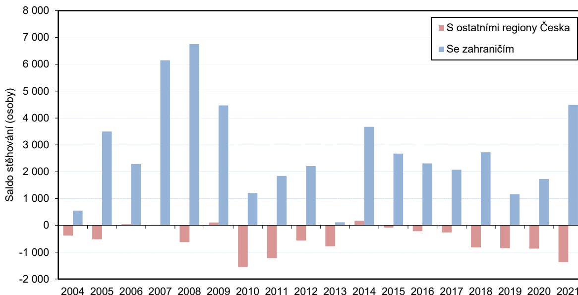
Obrázek 2: Saldo stěhování s ostatními regiony Česka a se zahraničím v hl. m. Praze v 1. čtvrtletí

Podíl dětí narozených mimo manželství se v Praze meziročně zvýšil na 42,1 % (za 1. čtvrtletí roku 2020 to bylo 41,4 %), stále zůstal pod průměrem Česka (48,8 %). Mezi kraji se jednalo o nejnižší hodnotu. Z celkového počtu 3 583 živě narozených dětí tvořily prvorozené děti 53,5 %, druhorozených bylo 36,1 % a děti třetího a vyššího pořadí se na všech živě narozených dětech podílely z 10,3 %.