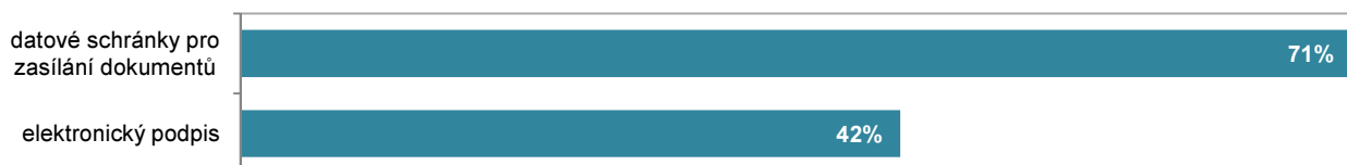
Graf 3.2: Podniky používající datové schránky a elektronický podpis při komunikaci s veřejnou správou, 2013