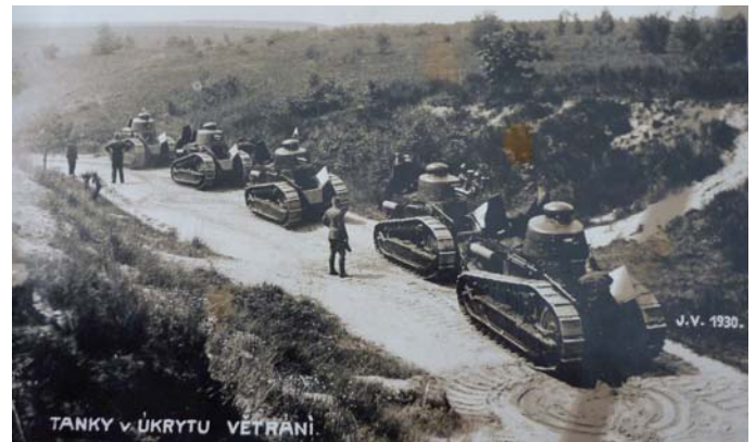
V okolí Milovic bylo v roce 1904 založeno vojenské cvičiště .

Nabízí se otázka, jaký populační vývoj zaznamenaly obce v území bývalých vojenských újezdů Ralsko a Dobrá Voda. Ukazuje se, že rozhodující vliv má minulé působení