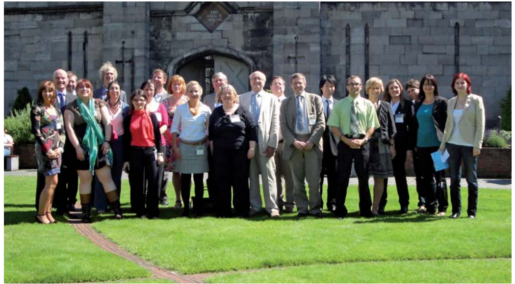
V červnu 2012 v Dublinu se sešla pracovní skupina k platební bilanci mezinárodního pohybu osob.

V rámci projektu byl rovněž simulován návrh modelu, kde současný bankovní založený systém může být nahrazen systémem založeným na primárních a sekundárních datech, hlavně na šetřeních o poptávce cestovního ruchu.