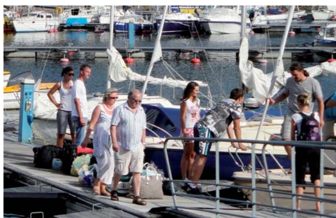
ČSÚ s podporou Eurostatu realizoval projekt zaměřený na cestovní ruch.

V současné době za kompilaci platební bilance mezinárodního