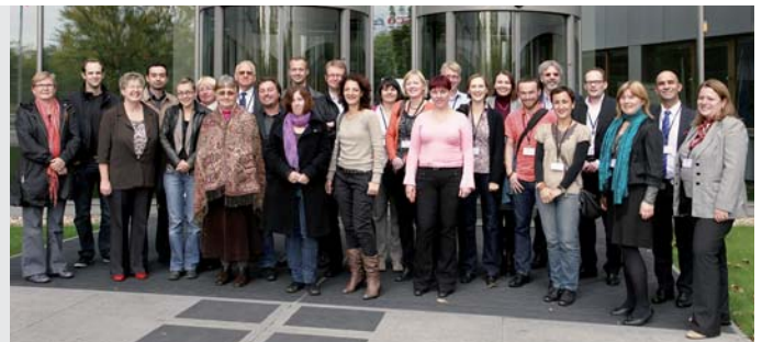
Účastníci mezinárodního kurzu Metadata Advanced .

náhled, praktická řešení a pohled na cílový stav statistického informačního systému vyvíjeného pod hlavičkou projektu Redesign SIS. ČSÚ je aktivním členem programu European Statistical Training Programme (ESTP) již od roku 2006. Poslední kurz byl jedním ze tří, které již nabídl v rámci spolupráce. Zúčastnilo se ho celkem 19 účastníků z členských států Evropské unie a Evropského sdružení volného obchodu, dále z Islandu, Lotyšska