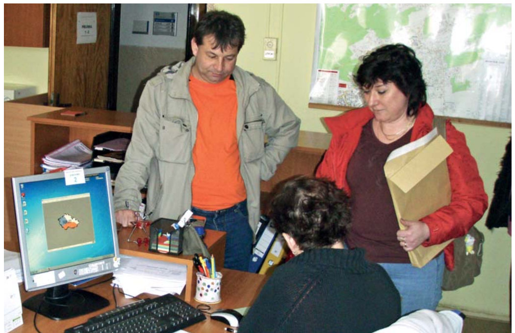
Zástupci volební komise předávají výsledky hlasování na přebíracím místě ČSÚ u pověřeného obecního úřadu.

Práce na přípravě „malých dovoleb“ v průběhu roku začíná zhruba tři měsíce před jejich konáním. Pracovníci v regionech na základě technického projektu a pokynů vydaných ústředím ČSÚ naváží kontakt s příslušným pověřeným obecním úřadem, zkontrolují údaje o obci, počtu volebních okrsků, počtu volených členů zastupitelstva a domluví podmínky pro vytvoření a provoz dočasného volebního pracoviště – přebíracího místa ČSÚ, včetně zajištění techniky a linek k přenosu dat. Dále přebírají od registračních úřadů kandidátní listiny i průběžné změny, rozhodnutí o registraci stran i vylosované pořadí stran na hlasovacím lístku – voličům známá čísla stran. Vytváří elektronický registr kandidátů a registrační úřad upozorňuje na zjištěné chyby, nepřesnosti a duplicitu kandidátů. Podílí se také na školení okrskových volebních komisí, které mají k dispozici metodické pokyny a instruktážní video vytvořené ve spolupráci s Ministerstvem vnitra České republiky. Pro okrskové volební komise, které chtějí využít počítač, je Řešitelským týmem připravováno programové vybá-