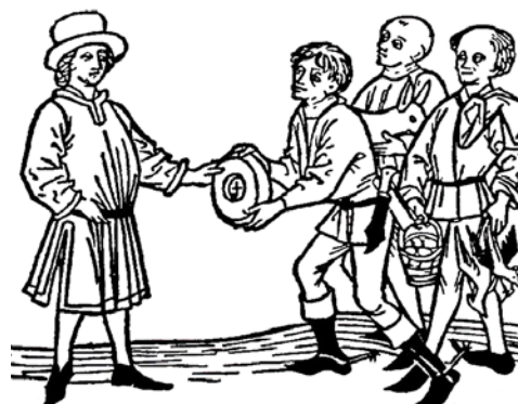
↑ Vybírání naturálních daní ve středověku.

Při každé změně poměrů se pořizovaly nové urbáře. Z urbářů se později vyvinuly vesnické pozemkové knihy, které obsahovaly zápisy z oblasti práva závazkového, dědického (závěti), rodinného (svatební smlouvy, nároky sirotků) a různé další doplňující údaje (dluhy, zbývající platby, inventář aj.).