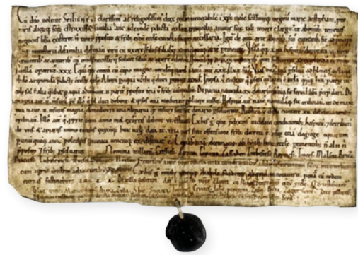
↑ Zakládací listina kostela sv. Štěpána v Litoměřicích, rok 1058.

za nejstarší dochovaný pramen, jemuž lze na našem území přisoudit i význam statistický, je soupis majetku litoměřického kostela sv. Štěpána? V zakládací listině kníže Spytihněv II. „...vybral z otrocké čeledi z každého svého hradu a z každého řemesla tak, jak se sluší na knížecí službu, muže se ženou, se syny a dcerami, náležejícího k jednomu každému řemeslu. Také daroval čtrnáct vsí, odevzdaných hostům a šest vsí, vykázaným služebníkům a oráčům se všemi nezbytnostmi, totiž s lesy a poplužími. Rovněž dal dvě vinice s vinaři, kolik by jich stačilo k jejich obdělávání, třicet mladých dělnic, také sto klisen s velkým polem a tolikéž ovcí, třicet krav a sedmdesát vepřů [...] Jména vsí jsou: Křešice, Brná, Popovo, Zásada, Travčice, Řepčice, Týnec, Malečov, Březí, Ptačice, Liběšice, Chouč, Bohušovice, Chotěšov.“