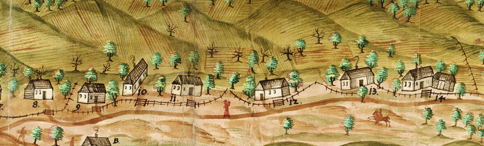
↑ Broumovský urbář. I staré mapy lze použít jako statistický pramen.