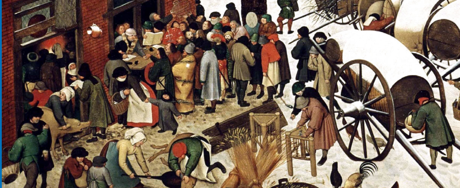
↑ Pieter Bruegel st.: Sčítání lidu v Betlémě (výřez).